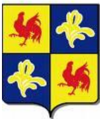
Commission Communautaire Française