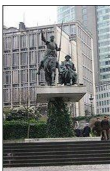
Don Quichotte en Sancho Pancha,

Helden van het boek: Don Quichotte van La Mancha van de Spaanse schrijver Miguel de Cervantes